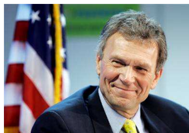
Americký ministr zdravotnictví Tom Daschle