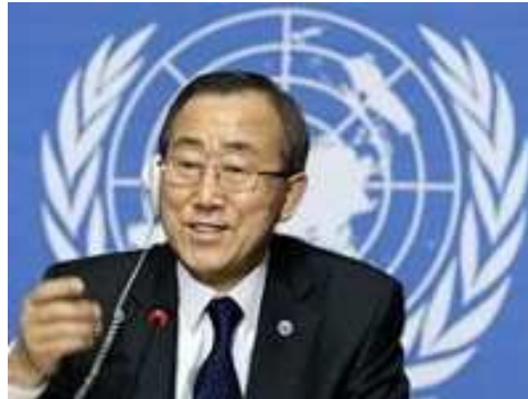
Pan Ki-mun