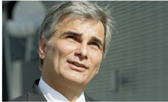
Rakouský kancléř Werner Faymann (SPÖ)

chce bojovat proti ekonomické krizi. Zejména daňovými úlevami má být podpořena koupěchťivost spotřebitelů.