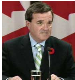
Kanadský ministr financí Jim Flaherty