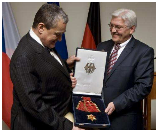
Ministři zahraničí Schwarzenber a Steinmeier