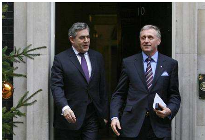
Gordon Brown a Mirek Topolánek

19.12.08 – Po schůzce českého předsedy vlády Mirka Topolánka s jeho britským protějškem Gordonem Brownem se Brown nechal slyšet, že neshledává nadcházející české předsednictví Evropské unii jako hrozbu a že Česká republika bude moci počítat s britským spojenectvím. Při Topolánkově návštěvě v „číslu deset“ přišla řeč také na summit EU-Pákistán, který by měl být v nadcházejícím půlroce uspořádán v Praze.