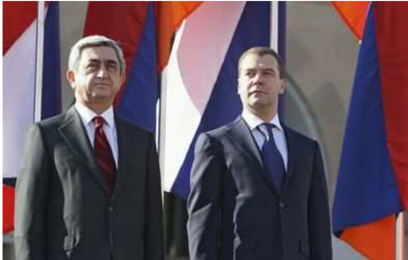
Sarkisjan a Medvěděv

účastnil slavnostního otevření náměstí Ruska. Arménský prezident S. Sarkisjana prohlásil, že „rusko-arménské přátelství nikdy neochablo“.