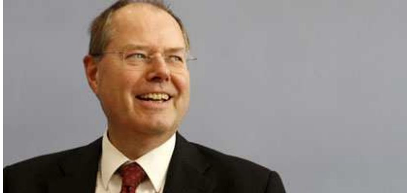
Ministr financí Steinbrück