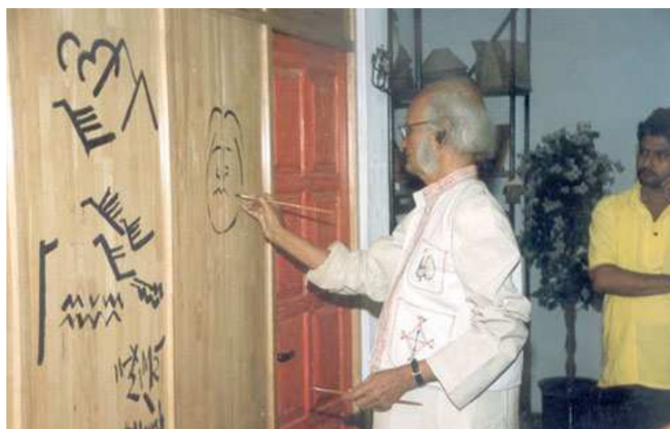
Paritosh Sen