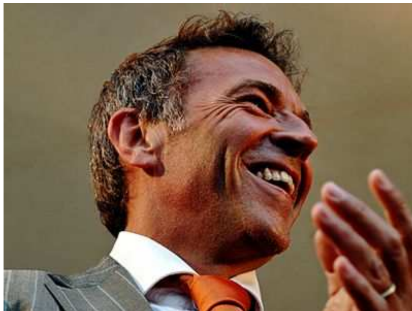
Jörg Haider