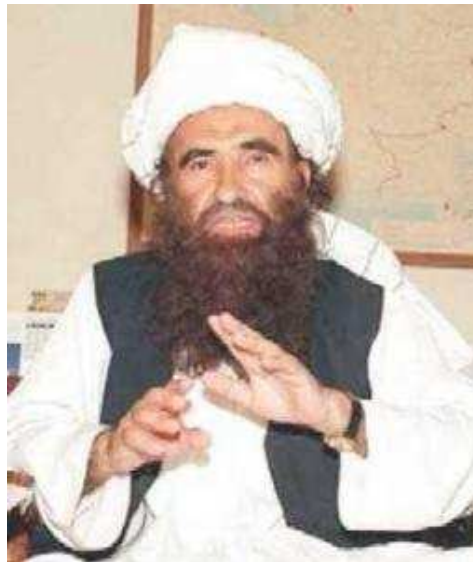
Džaláluddín Hakkání