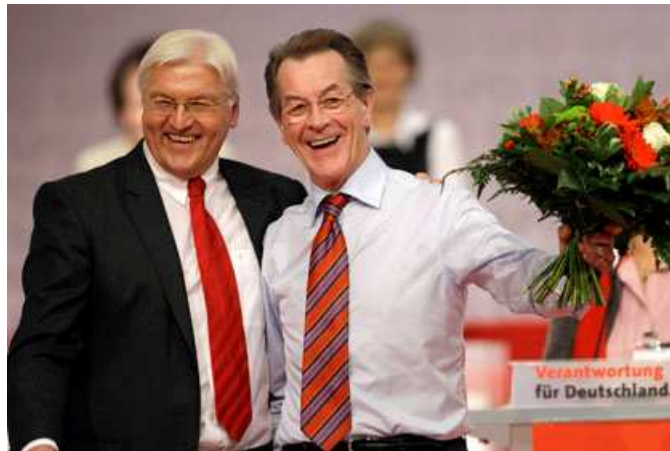
Franz Müntefering a Franz Walter Steinmeier

Kurta Becka. S více než 95 procenty hlasů delegátů byl zároveň na sjezdu zvolen kandidátem na německého kancléře spolkový ministr zahraničních věcí Franz Walter Steinmeier.