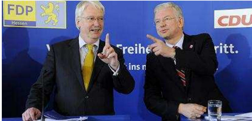
Hesenští předsedové stran Jörg-Uwe Hahn (FDP) a Roland Koch (CDU)